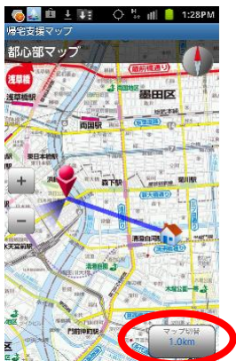
【目的地までの距離表示】

「GPS 計測」ボタンで最新の自分の位置を全画面で表示することができ、目的地までの直線距離が表示されます。歩いたところは自動的に軌跡点(50 or 300メートル間隔)を表示しますので、進行方向の正誤確認を容易に行えます。また、電子コンパス機能と連動していますので、サーチライトが開いている方向を確認することで、自分がどちらに向いているかを知ることができます。