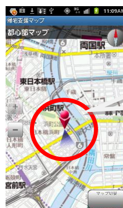
【自位置とサーチライト】