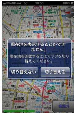
【自位置から目的地までの距離表示】