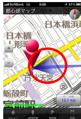
【自位置とサーチライト】